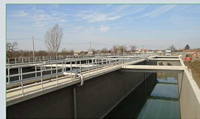
SEAU Satu Mare

SM-CL-01 - Extinderea cu treaptă terțiară a stației de epurare a apelor uzate din Satu Mare: Lucrările de construcții, respectiv instalațiile hidraulice, mecanice și electrice sunt finalizate în proporție de 100%. În prezent se lucrează la executarea lucrărilor de automatizare (SCADA), peisagistică și drumuri de incintă. În cursul lunii aprilie a.c. încep testele de fiabilitate la SEAU Satu Mare. Progresul fizic total pe contract este de 94%.