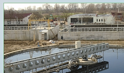
SEAU Satu Mare

SM-CL-03 - Reabilitarea stației de tratare a apei potabile și captărilor din Negrești-Oaș, reabilitarea stației de tratare a apei potabile din Tășnad și construirea unei stații de tratare a apei potabile și captărilor din Livada: La STAP Tășnad lucrările sunt finalizate în proporție de 100%. Ca urmare a finalizării cu succes a testelor de fiabilitate, la STAP Tășnad a început procedura de recepție la terminarea lucrărilor. La STAP Negrești-Oaș și STAP Livada sunt finalizate, în proporție de 100%, lucrările de construcții, respectiv lucrările de montare a echipamentelor și instalațiilor hidraulice prevăzute în contract. În prezent se execută lucrări de automatizare (SCADA) la cele două stații și lucrări civile la captarea de pe Râul Tur. Progresul fizic total pe contract este de 85%.