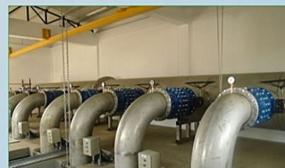
SEAU Satu Mare

SM-CL-04 - Reabilitarea și extinderea stației de epurare a apelor uzate din Negrești-Oaș și construirea unei stații de epurare în Livada: Lucrările de execuție la SEAU Negrești Oaș și SEAU Livada continuă. Se execută lucrări de construcții, clădiri și bazine. Progresul fizic total pe contract este de 42%.